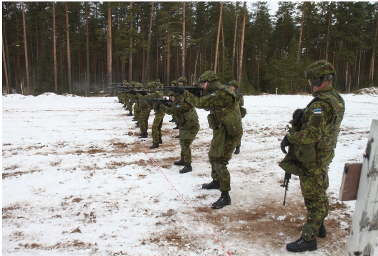
Pilt 3. 25m tulejoon püsti asend.