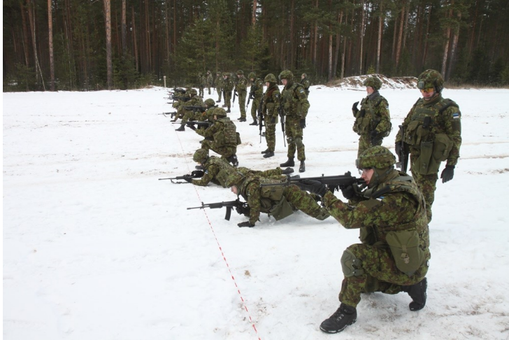
Pilt 2. 50m tulejoon põlvelt asend.