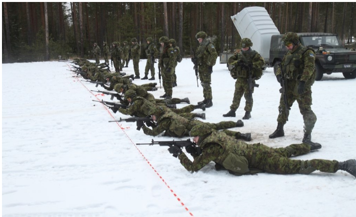
Pilt 1. 100m tulejoon lamades asend.